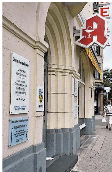
In der Praxis in diesem Saarbrücker Haus ging der Angreifer gestern Morgen auf seinen Arzt los.

Gegen 8.30 Uhr hatte der in Saarbrücken gemeldete Mann die Praxis in der Sulzbachstraße betreten. Er stand im Bereich der Anmeldung, als der Arzt gerade aus einem Sprechzimmer kam. Nach Polizeiangaben ging er unvermittelt auf