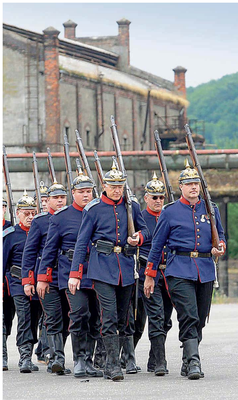
Im Gleichschritt, Marsch: Akteure des historischen Spektakels bei einer Probe am Weltkulturerbe Völklinger Hütte.